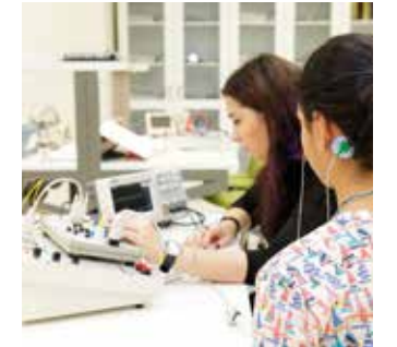
MEDİKAL CİHAZLAR ve ROBOTLAR ATÖLYESİ