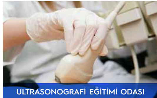
ULTRASONOGRAFİ EĞİTİMİ ODASI