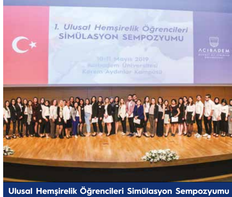
Ulusal Hemşirelik Öğrencileri Simülasyon Sempozyumu