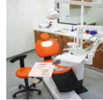
AĞIZ VE DİŞ SAĞLIĞI LABORATUVARI

Ön lisans ve lisans programlarında teorik bilgiyi destekleyici uygulamalı eğitimler ileri teknoloji ile donatılmış Öğrenci Laboratuvarları'nda gerçekleştirilir.