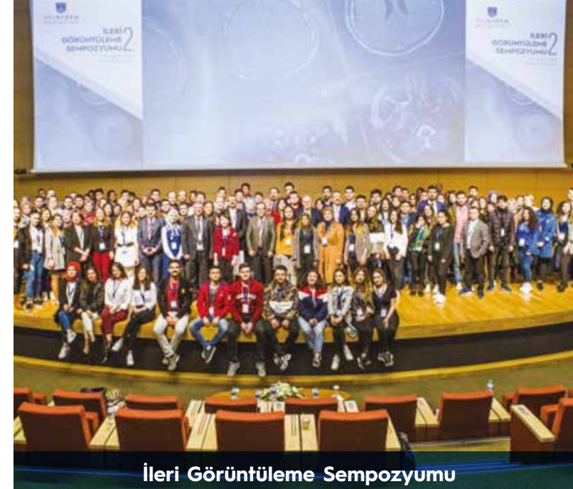
İleri Görüntüleme Sempozyumu