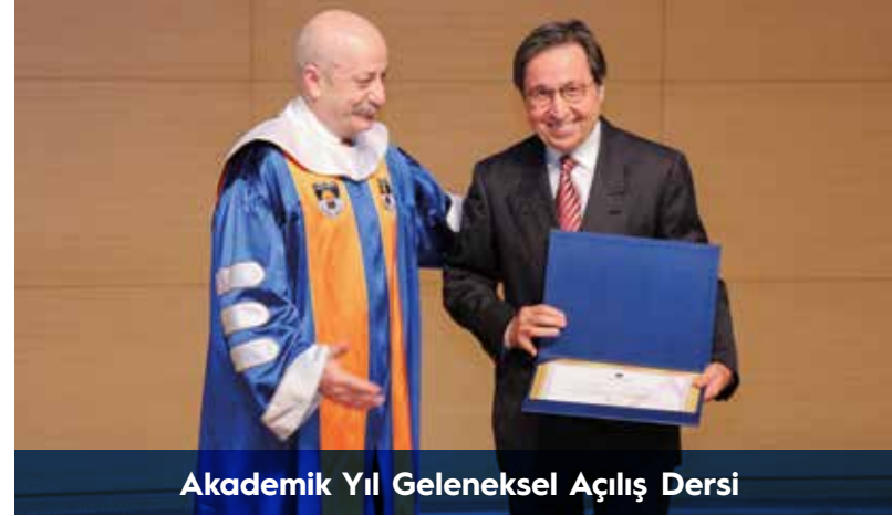
Akademik Yıl Geleneksel Açılış Dersi