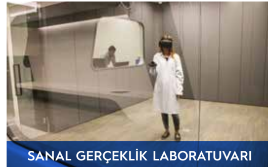
SANAL GERÇEK LİK LABORATUVARI