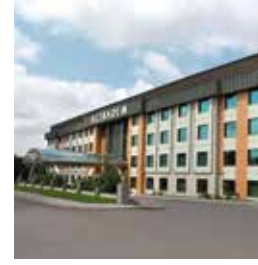
Acıbadem Kayseri Hastanesi