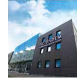
International Medical Center Amsterdam