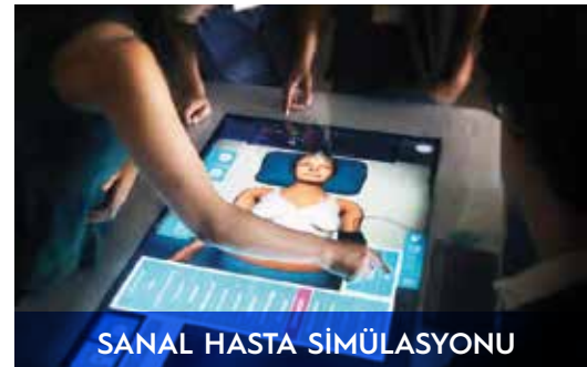
SANAL HASTA SİMÜLASYONU