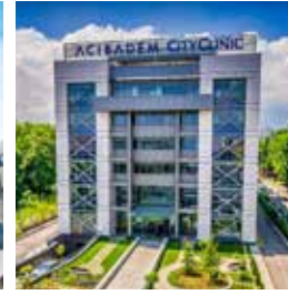
Acıbadem City Clinic Mladost Hospital