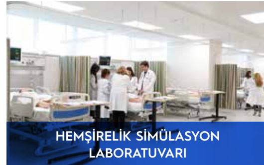
HEMŞİRELİK SİMÜLASYON LABORATUVARI