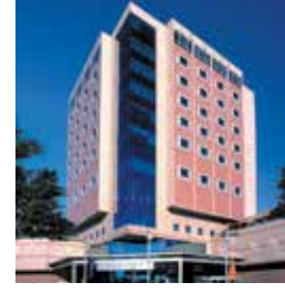
Acıbadem Bakırköy Hastanesi