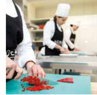
AŞÇILIK MUTFAK LABORATUVARI