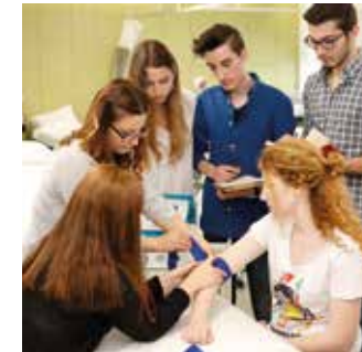
FİZİYOTERAPİ VE REHABİLİTASYON UYGULAMA SALONU