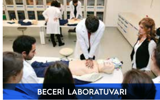
BE CER İ LABORATUVARI