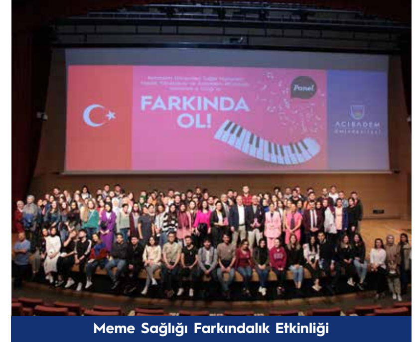
Meme Sağlığı Farkındalık Etkinliği