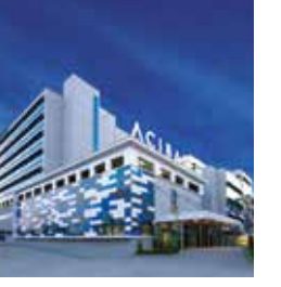
Acıbadem Adana Hastanesi