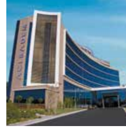
Acıbadem Eskişehir Hastanesi