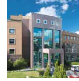
Acıbadem Dr. Şinasi Can (Kadıköy) Hastanesi