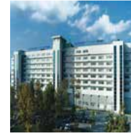
Acıbadem City Clinic Tokuda Hospital