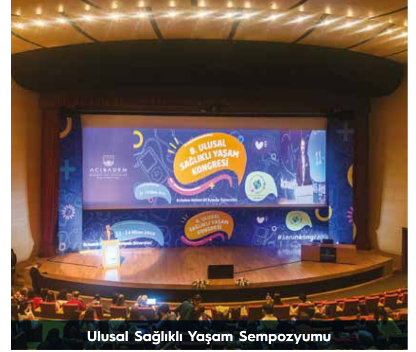
Ulusal Sağlıklı Yaşam Sempozyumu