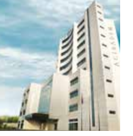
Acıbadem Fulya Hastanesi