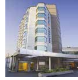
Acıbadem International Hastanesi