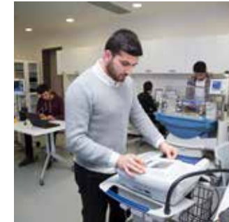
TIBBİ CİHAZ TEST VE KALİBRASYON LABORATUVARI