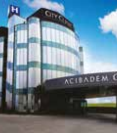
Acıbadem City Clinic Cardiovascular Center