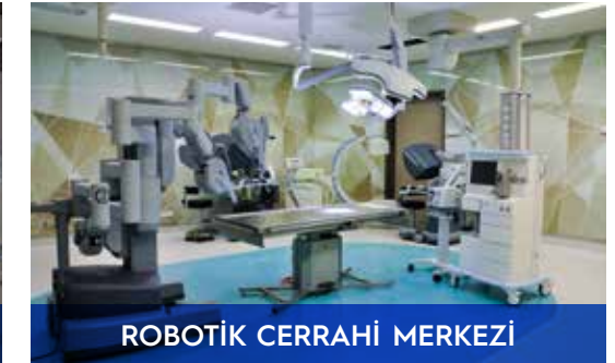
ROBOTİK CERRAHİ MERKEZİ