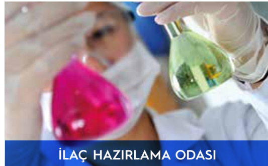
İLAÇ HAZIRLAMA ODASI