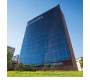
Acıbadem Ankara Hastanesi