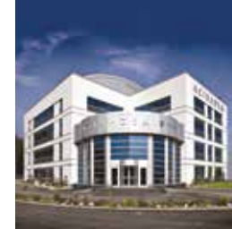
Acıbadem Kocaeli Hastanesi