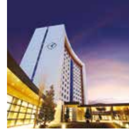
Acıbadem Üniversitesi Atakent Hastanesi