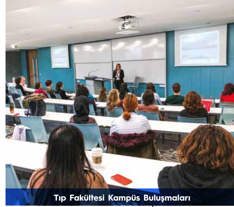
Tıp Fakültesi Kampüs Buluşmaları