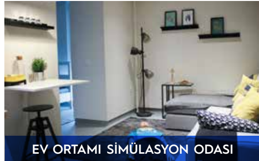
EV ORTAMI SİMÜLASYON ODASI