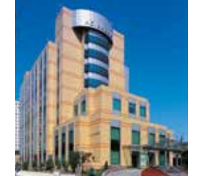
Acıbadem Kozyatağı Hastanesi