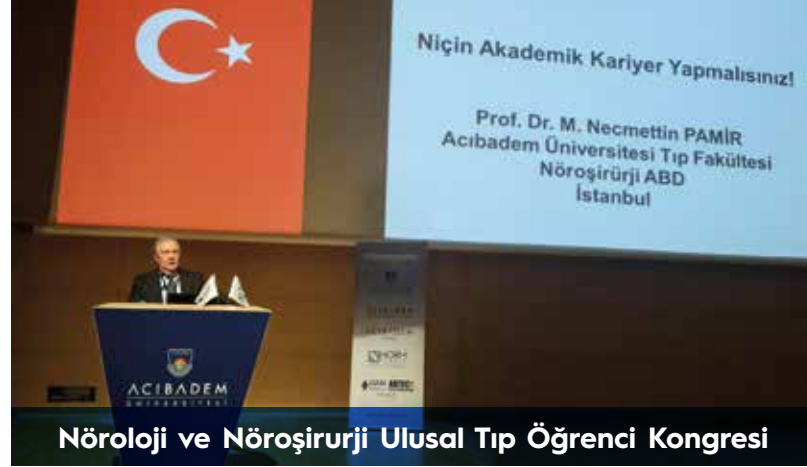
Nöroloji ve Nöroşürji Ulusal Tıp Öğrenci Kongresi

Acıbadem Üniversitesi yıl boyunca ulusal ve uluslararası birçok etkinliğe ev sahipliği yapıyor.