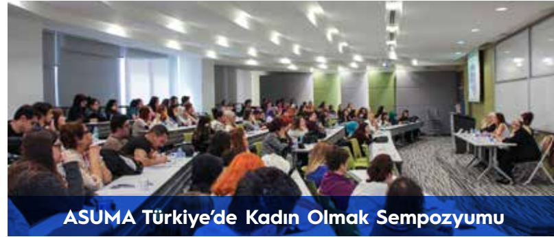
ASUMA Türkiye'de Kadın Olmak Sempozyumu