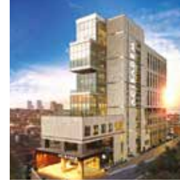
Acıbadem Taksim Hastanesi