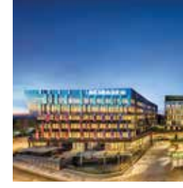
Acıbadem Altunizade Hastanesi