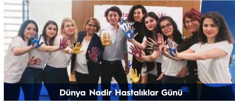
Dünya Nadir Hastalıklar Günü