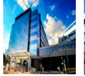
Acıbadem Sistina Hastanesi